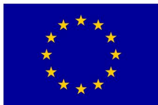
Euroopa Liit Euroopa Sotsiaalfond